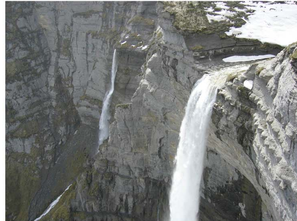
La cola del caballo

Para conocer los animales y plantas de Burgos