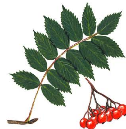
Serbal de cazadores