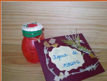
Colonia de bosque 13 marzo