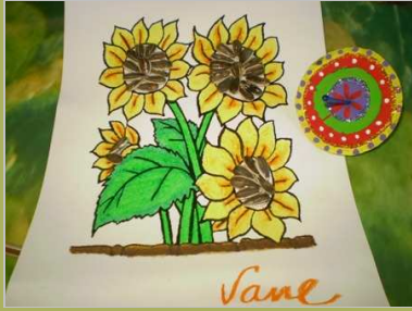
Gira y gira 10 abril