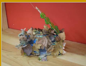
Una casa en el bosque 28 noviembre