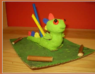
¡Vaya dragón! 16 enero