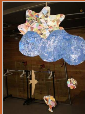
¡Mirad por la ventana! 20 marzo