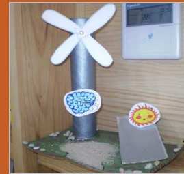
¡Necesito un poquito de... energía! 13 febrero