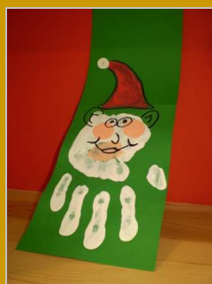
Tarjetas medioambientales 19 diciembre