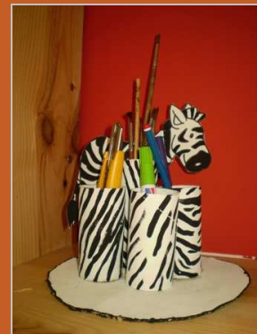
¿Te gusta mi vestido de rayas? 27 marzo