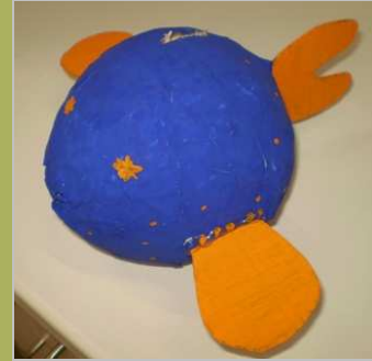
Entre peces anda la mosca 24 abril