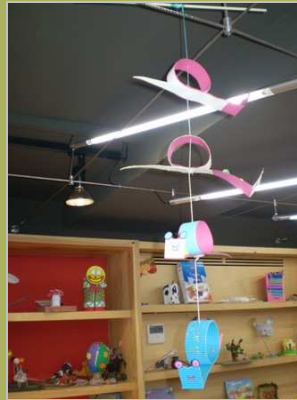
Sigue mi rastro 15 mayo