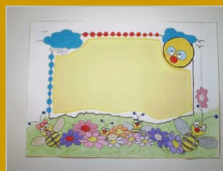
Un recordatorio muy peculiar... 21 noviembre