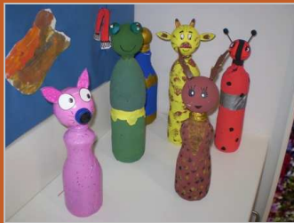
Unos bolos muy animados... 30 enero