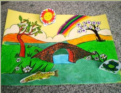
Paisaje ribereño 29 mayo