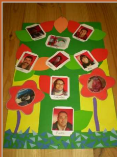
Retrato de familia 20 febrero