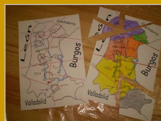
¿Dónde estamos? 12 diciembre