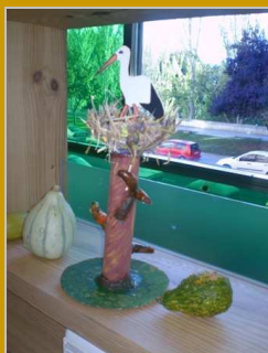
La reina de las alturas 17 octubre