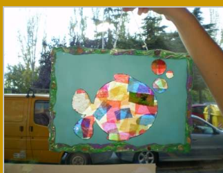
El planeta azul 24 octubre