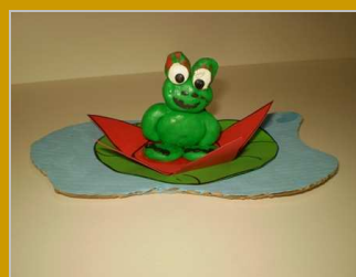
Entre tierra y agua 31 octubre