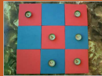
Rebelión en la granja 6 marzo