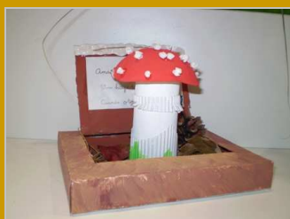
¡Cuidado donde pisas! 14 noviembre