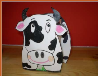
Una chica con muy buena leche 6 febrero