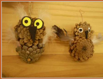
¿Quién ulula? 9 enero