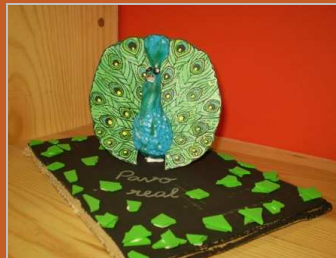
¿Cual es el sonido de la danza? 27 febrero