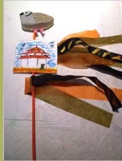
Palomas y palomares 17 abril