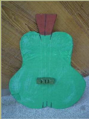
Frutas musicales 8 mayo