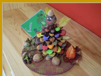
Figuritas del bosque 7 noviembre