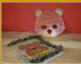
La despensa del oso 5 diciembre